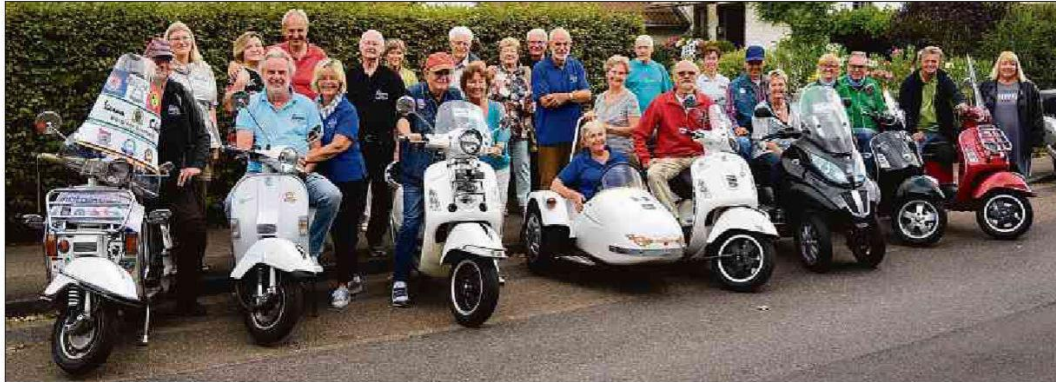
Die Liebe zur Vespa eint die Mitglieder des Vespa-Clubs Bergisch Gladbach nun schon seit 25 Jahren.