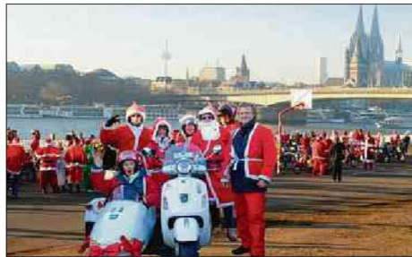
Auch bei der Nikolausfahrt der Kölner „Rhein-Schalter“ für einen guten Zweck machten die Gladbacher mit.